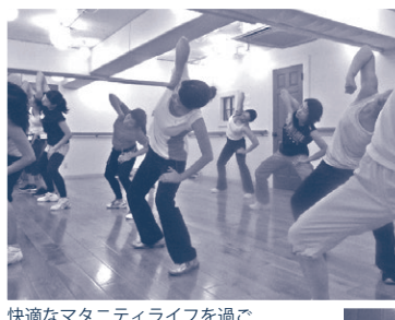
快適なマタニティライフを過ごしてもらうための内容が組み込まれています。