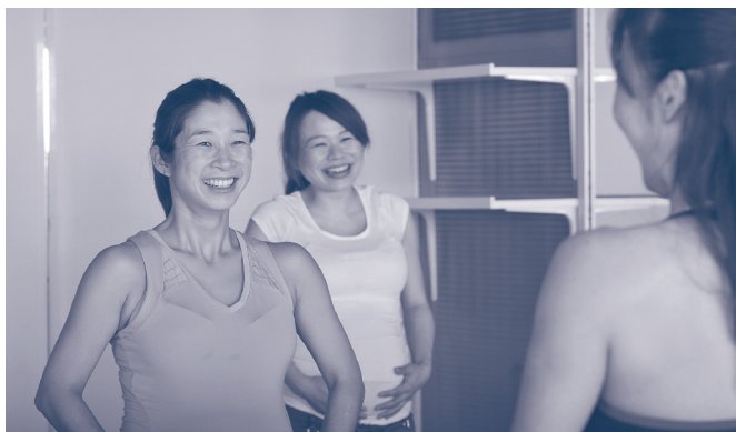
ひとりでも多くの妊婦さんの笑顔のために

※非会員の方のみ、別途、資格登録料（3,240円）が必要となります。なお、資格更新に必要なポイントの取得は、マタニティフィットネスアドバイザーには不要です。