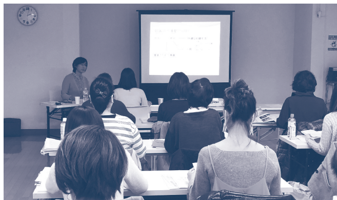
講義と実技の充実の2日間

★お申し込みは協会HPまたはFAXで承っております。お気軽にお問い合わせください。